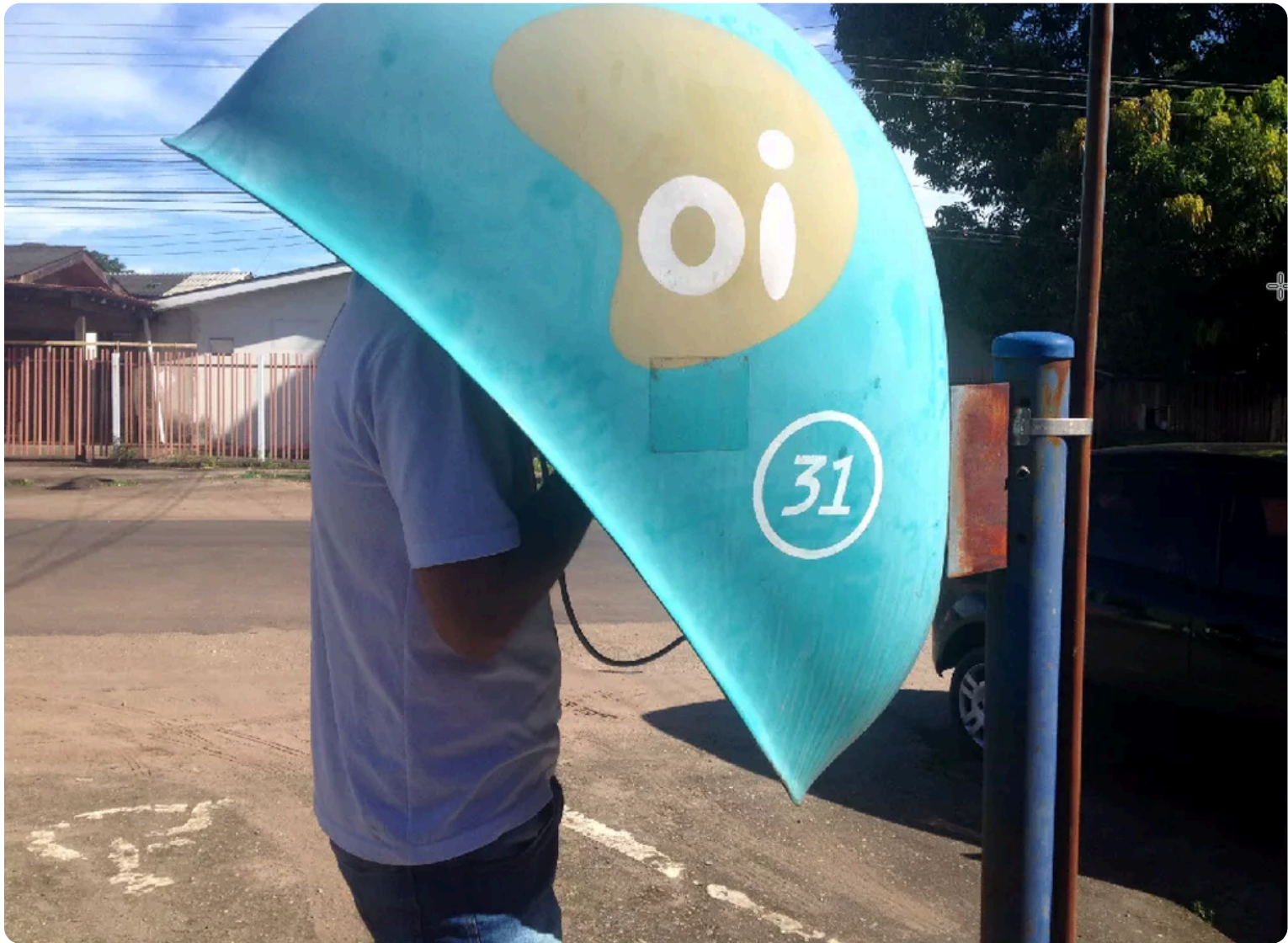
orelhão, dificuldade, ligação, celular, Macapá, Amapá

Esse serviço deverá ser mantido pela Oi, segundo determinação judicial, até que outra operadora assuma a operação.